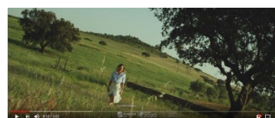
FROM FARM TO TABLE

https://www.youtube.com/watch?v=Ccv6C8bra0